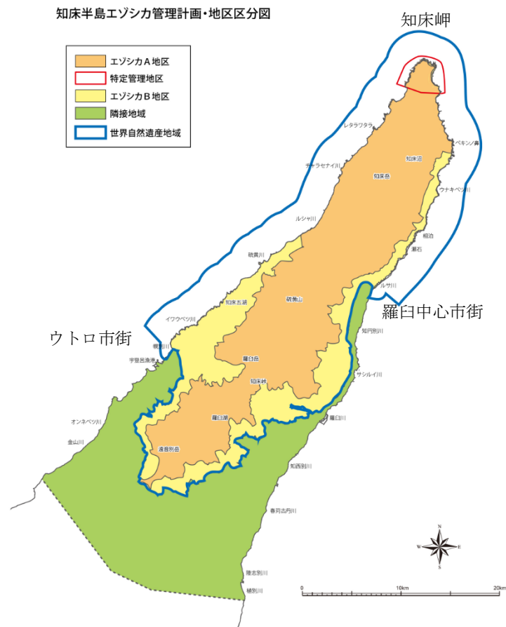
図1. 知床半島エゾシカ管理計画対象地域

遺産地域に隣接する区域で、斜里町側については幌別川から金山川付近まで、羅臼町側についてはルサ川から植別川付近までの範囲とする。遺産地域を利用するエゾシカの移動範囲に含まれると推定される。