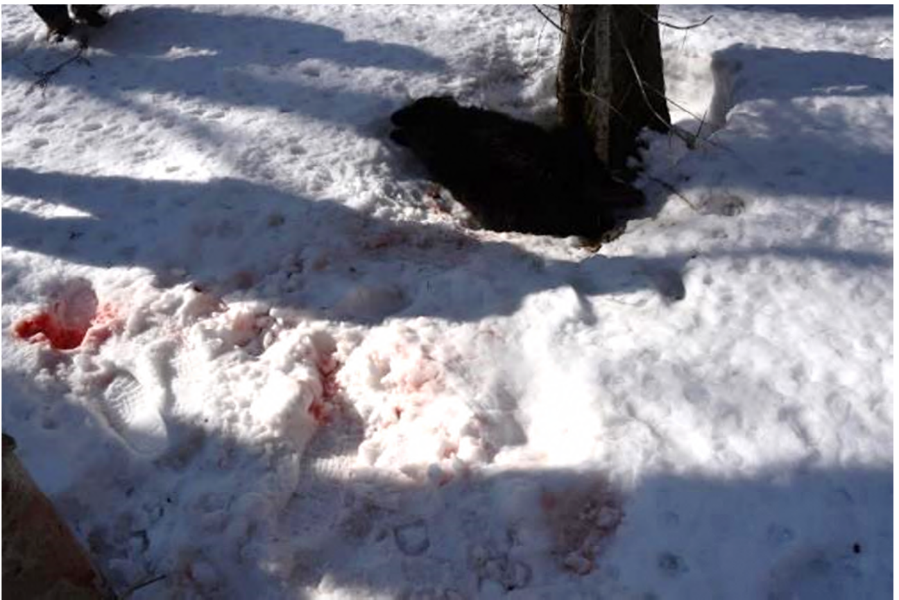
写真2. A氏が襲われた地点