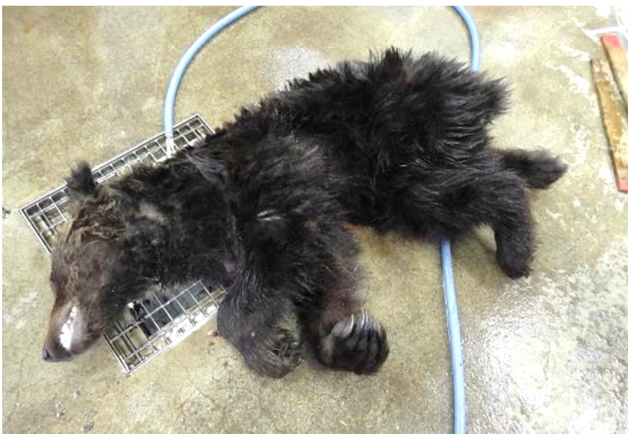
写真 4. 当該個体 オス推定 2 歳 実測体重 25 kg