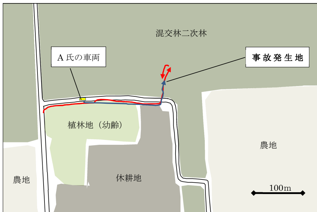
図 2. 事故現場略図 (図内の →: ヒグマ足跡、→: A 氏のスキー跡)