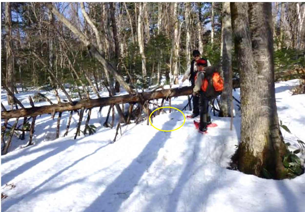
写真 3. 当初の発見時（初弾発砲時）に当該個体があった位置（黄色円内）