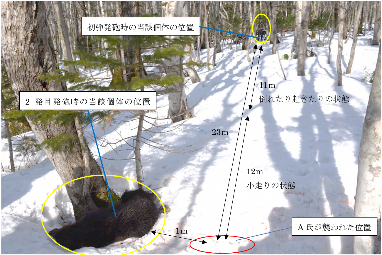
写真1. 事故発生現場