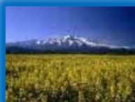
美しく雄大な自然

独特の自然や文化といった本道の魅力を活かしたATを振興することで、観光消費額の増といった本道観光の更なるレベルアップが期待される。