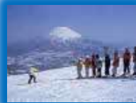
多様なアクティビティ