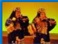
独自の歴史・文化