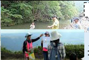
②旅館等での環境整備