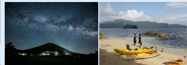
星空撮影イベント