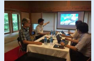
イメージ図 （鳴子温泉郷（大崎市））