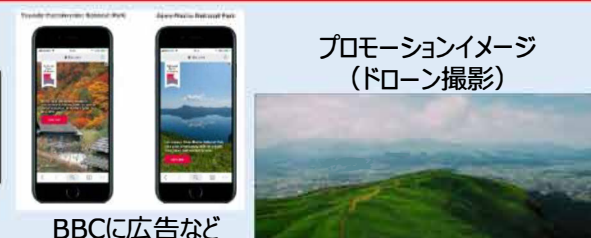
プロモーションイメージ (ドローン撮影)