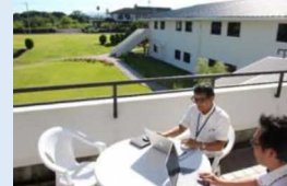
イメージ図（南紀白浜（白浜町））