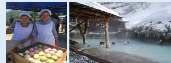
ガストロノミーウォーキング（500人程度参加）