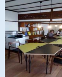
イメージ図 （鉄輪温泉（別府市））