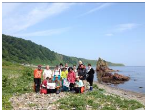
（株）知床らうすリンクル ツアー紹介資料より抜粋

知床の豊かな生態系から恩恵を受け、厳しくもある知床岬先端部の自然の中で生活しながら家族単位で営まれてきた漁業と自然との共生の歴史・文化を後世に遺したいという想いのもと、本ツアーを実施しています。