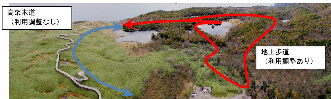
知床五湖利用調整地区における地上歩道と高架木道の位置関係