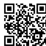
bear_safety shiretoko (Instagram)