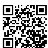
Bear Safety Shiretoko (X : 旧 Twitter)