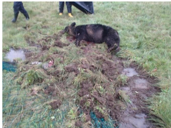
写真3：岬町のコミュニティセンター裏のネット付近で滞留するヒグマ（左）と、そばにあった土饅頭（右）