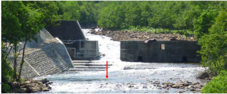
平成22年6月 施工後の状況