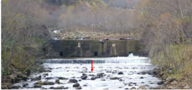
平成21年度 着工前(下流側)