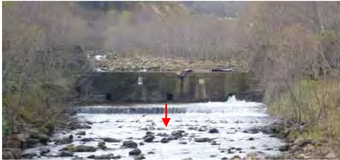
平成21年度着工前(下流側)