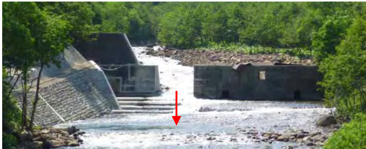
平成21年度施工後(下流側)