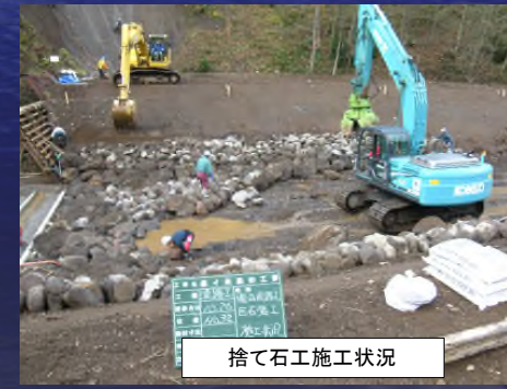
捨て石工施工状況