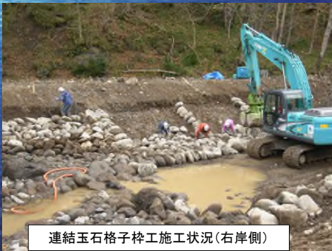
連結玉石格子枠工施工状況(右岸側)