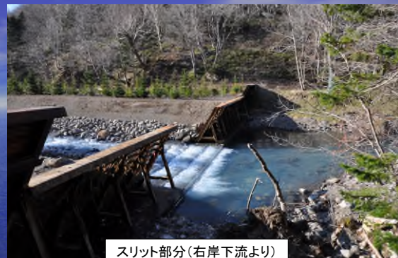
スリット部分(右岸下流より)