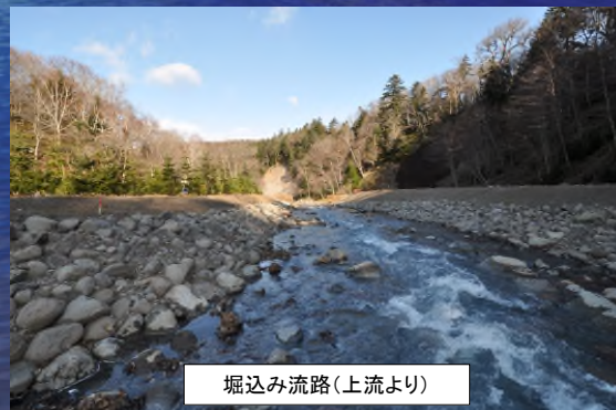
堀込み流路(上流より)