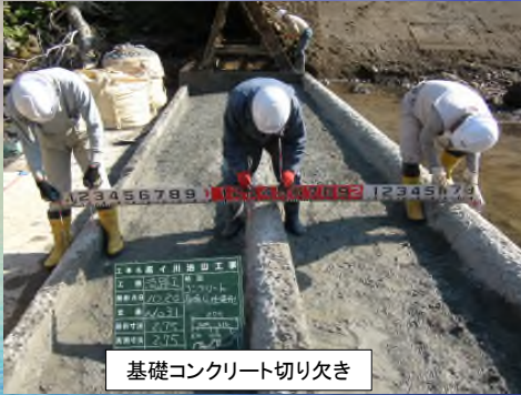
基礎コンクリート切り欠き