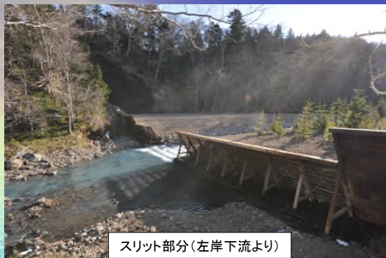
スリット部分(左岸下流より)