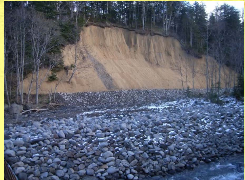
堀込流路と護岸工（下流より）