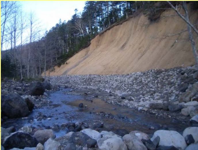
分流堰と護岸工（上流より）