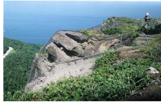
B002 頂上岩塊亀裂写真