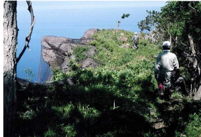
B002 頂上岩塊亀裂写真②