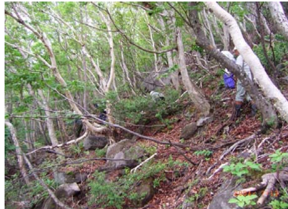
斜面部転石状況写真