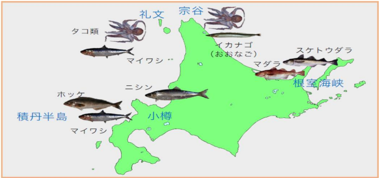
図3 平成 29(2017)年 11 月～平成 30(2018)年 5 月 トド胃内容物標本から出現した主要餌生物【速報】