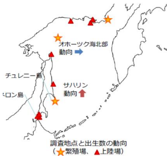
図 4 調査地点と出生数の動向