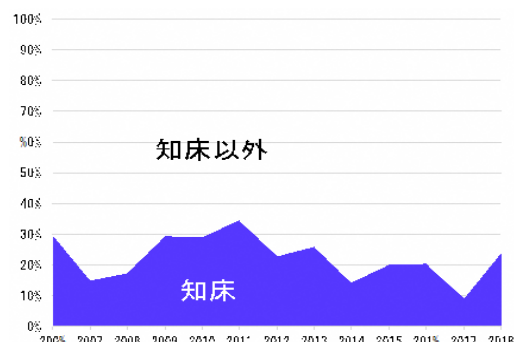
図 3 北海道内ワシ類合計個体数における知床の割合