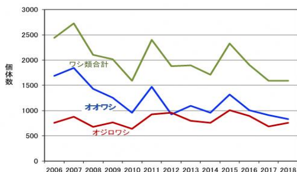
図 2 2006～2018 年の一斉調査結果