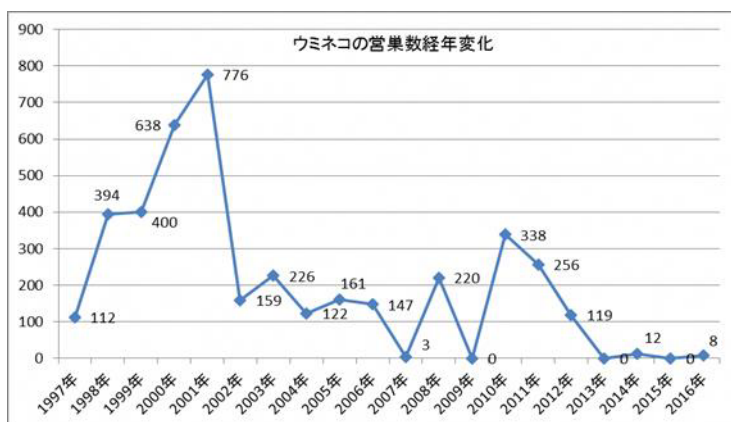
図2 ウミネコの営巣数の経年変化