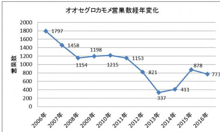
図3 オオセグロカモメの営巣数の経年変化