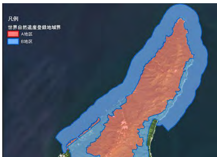
距岸3 kmまでの遺産地域内海域（図1）