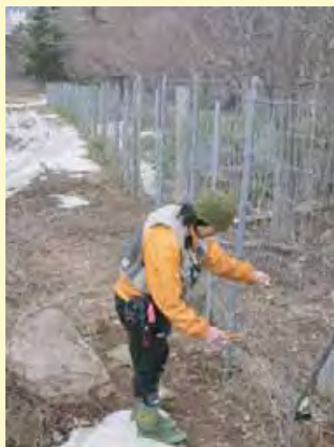
電気柵はヒグマの侵入防止に有効です。しっかり電気が流れているか、日々のメンテナンスが欠かせません。