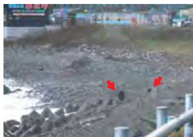
ウトロの海岸に出没したヒグマの親子

90年代以降、目撃数は増減を繰り返しながら増加する傾向にあり、近年は高止まりの状況です。今後もしっかりと記録を残していくことが重要です。