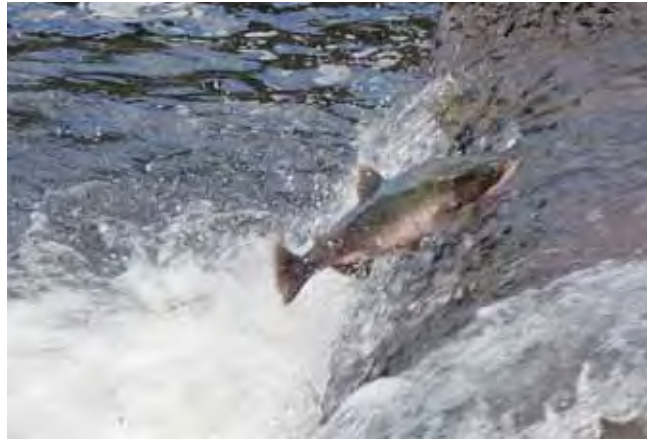
改良後のダムを遡上するカラフトマス（斜里町ルシャ川）