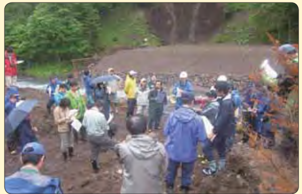
現地検討会の様子(斜里町赤イ川)

今回の現地検討会では、ダムの上流に堆積している土砂をどのように処理していくのかという意見がでました。ダムにスリットを入れた後に、堆積していた土砂をそのままにしておくと、海が濁ることも心配されます。しかしながら、漁業関係の方々にも検討していただいた結果、サケの産卵環境には上流から小さな砂利が流れてくることが必要であり、堆積している土砂は濁りの少ない粗いものであることから、自然に任せて流すことにしました。