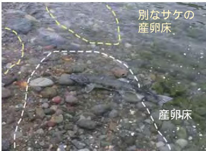
シロザケの産卵床（羅臼町サシルイ川 2007年12月）

改良前に比べて、たくさんのサケがダムの上流まで遡上し、産卵床を作るようになりました。産卵床というのは、サケが川底を掘って卵を産み、埋め戻した場所のことです。羅臼町のサシルイ川では、4年前にサケのがぼりやすいように魚道の改良を行いました。改良後に行った調査からは、これまでダムの手前で産卵していたサケが上流で産卵するようになり、産卵床の数も増えたことがわかっています。