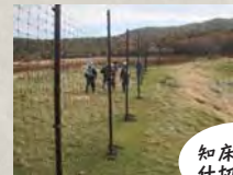
知床岬の仕切り柵