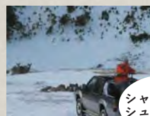
シャープシューティング

餌付け場のシカの頭や首をライフル銃で狙撃する方法。シカが逃走して警戒心を高めないう、その場のシカを全滅させます。