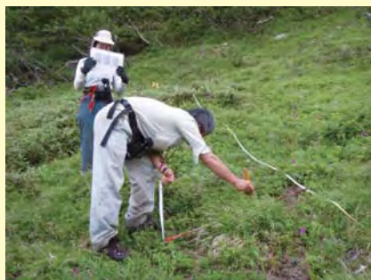
▲亜高山帯での植生調査の風景