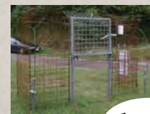
囲いワナの自動落下ゲート