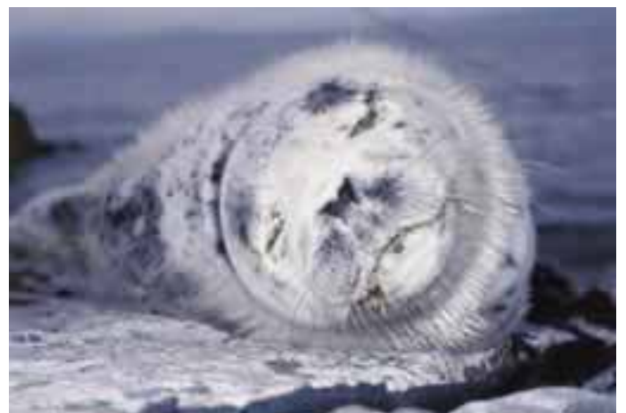
ゴマフアザラシ Phoca largha

さらに、海域の生態系は、海水の流れによって物質や生物が運ばれることから、広域的につながり合っているという特質を持つ。そ