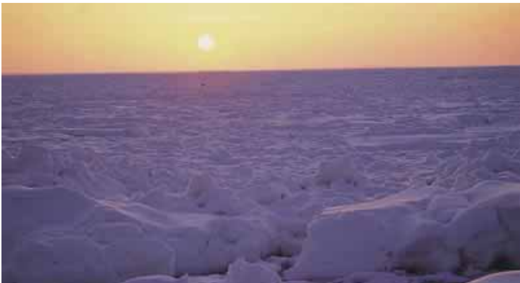
海氷と夕焼け (写真：倉沢栄一)

昭和49年（1974年）には、国立公園指定10周年を契機とし、斜里町及び羅臼町が町民と共に知床憲章を制定した。その中で、知床の原始的自然を人類共有の財産と位置づけ、厳正な保護と秩序ある利用の下に、永く子孫に伝えていくことを宣言した。また、開拓跡地を乱開発から守るために買い上げ、さらに原始の森へと再生す