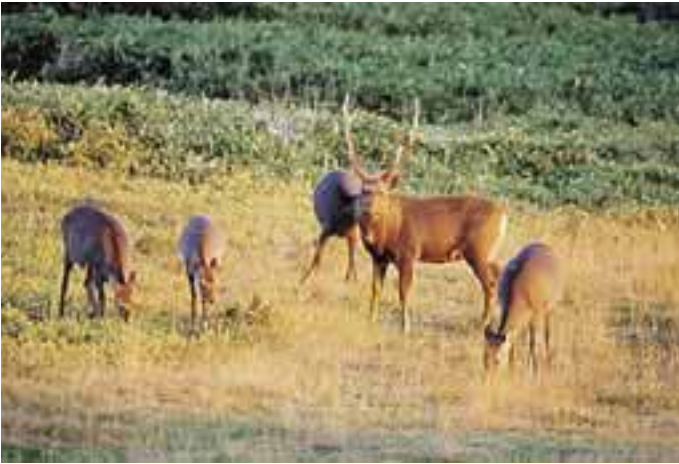
エゾシカ Cervus nippon yesoensis