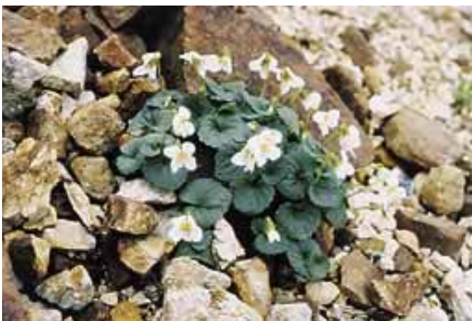
シレトコスミレ Viola kitamiana

積雪期における航空機を用いた分布調査、死亡収容個体からの年齢査定調査、斜里町・羅臼町が主体となったスポットライトセンサスなどにより生息動向を把握するとともに、エゾシカの採食による植生への被害状況をモニタリングし、関係行政機関、関係団体、専門家等と協力して候補地周辺を含む知床におけるエゾシカの管理計画を作成する。