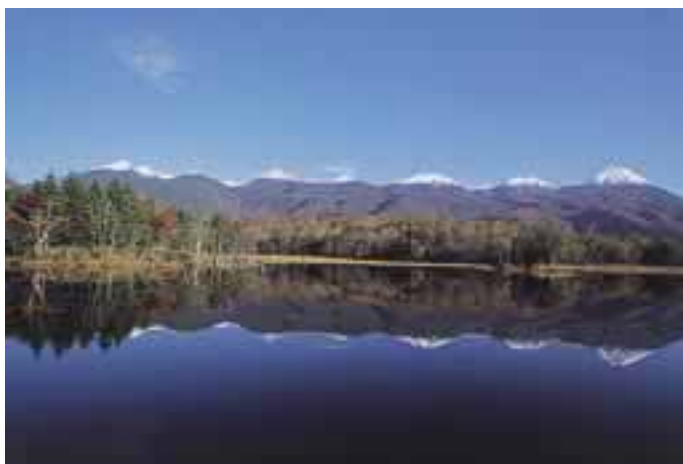
知床五湖と連山

同法に基づき、昭和55年（1980年）2月に遠音別岳周辺が知床国立公園の区域から除外され、「遠音別岳原生自然環境保全地域」に指定された。この原生自然環境保全地域の全域が候補地に含まれている。