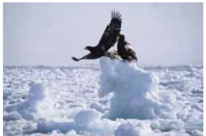
オオワシ Haliaeetus pelagicus