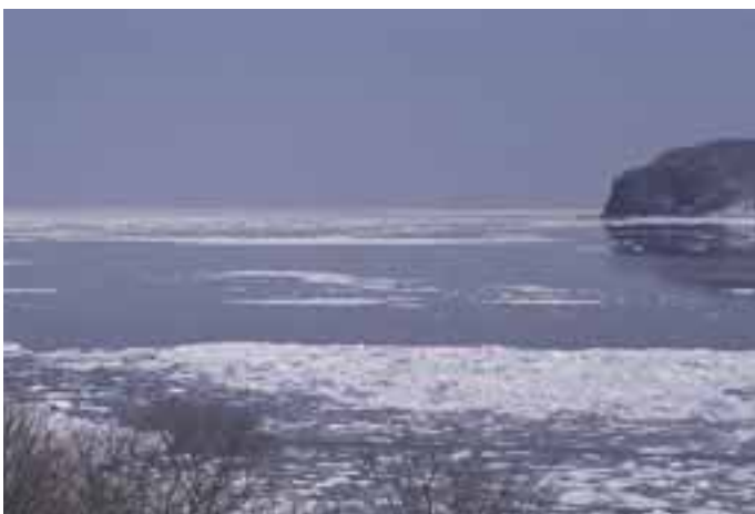
オホーツク海の流水

オホーツク海は、地形的・地理的条件により流水ができる海洋として世界で最も低緯度に位置する季節海水域である。これは、オホーツク海が表層と中層以深の塩分濃度が著しく異なる二重の海洋構造を形成していること、周囲を陸で囲まれ、外海との海水の交換が極めて少ないこと、シベリアの寒気が吹き抜けるため海水が効率的に冷却されること、という特異な条件がそろうためである。また、候補地及び周辺地域はオホーツク海で形成された流水が接岸する最南端の地であり、この流水は植物プランクトンを育み、それを餌とする動物プランクトン、さらに高次消費者である魚類や海棲哺乳類、陸上の生物にまでつながる食物連鎖網を支えている。