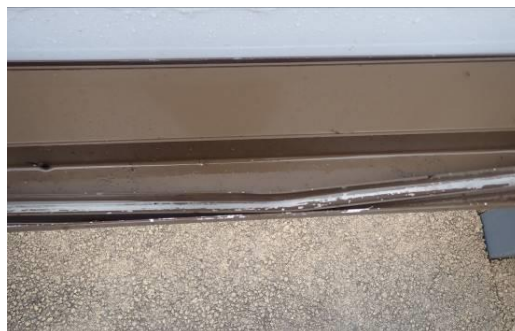
フレームのゆがみ