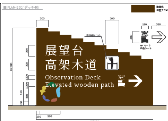
高架木道入口広場から見た面