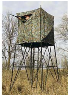
図3: 市販品のハイシートの一例

フェンス延長距離：A~D:1982m B~C:1021m 計:3003m（距離は概算）