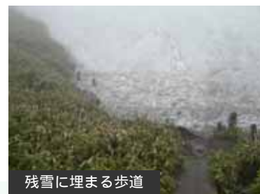
残雪に埋まる歩道

一帯はヒグマの高密度生息域のため、ヒグマ対策（クマスプレー、鈴等の装備やヒグマに出会わないための心得）が不可欠です。歩道は見通しが悪いため、自分の位置を知らせるなどして突発的な遭遇に十分に注意して下さい。