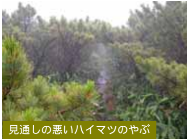
見通しの悪いハイマツのやぶ

5月～7月上旬は残雪で歩道が埋まり、ガス（霧）がかかりやすいため、大変迷いやすくなっています。また無雪期でもぬかるんでいたり、ササ、ハイマツのやぶとなっていたりするため、歩きにくくなっています。